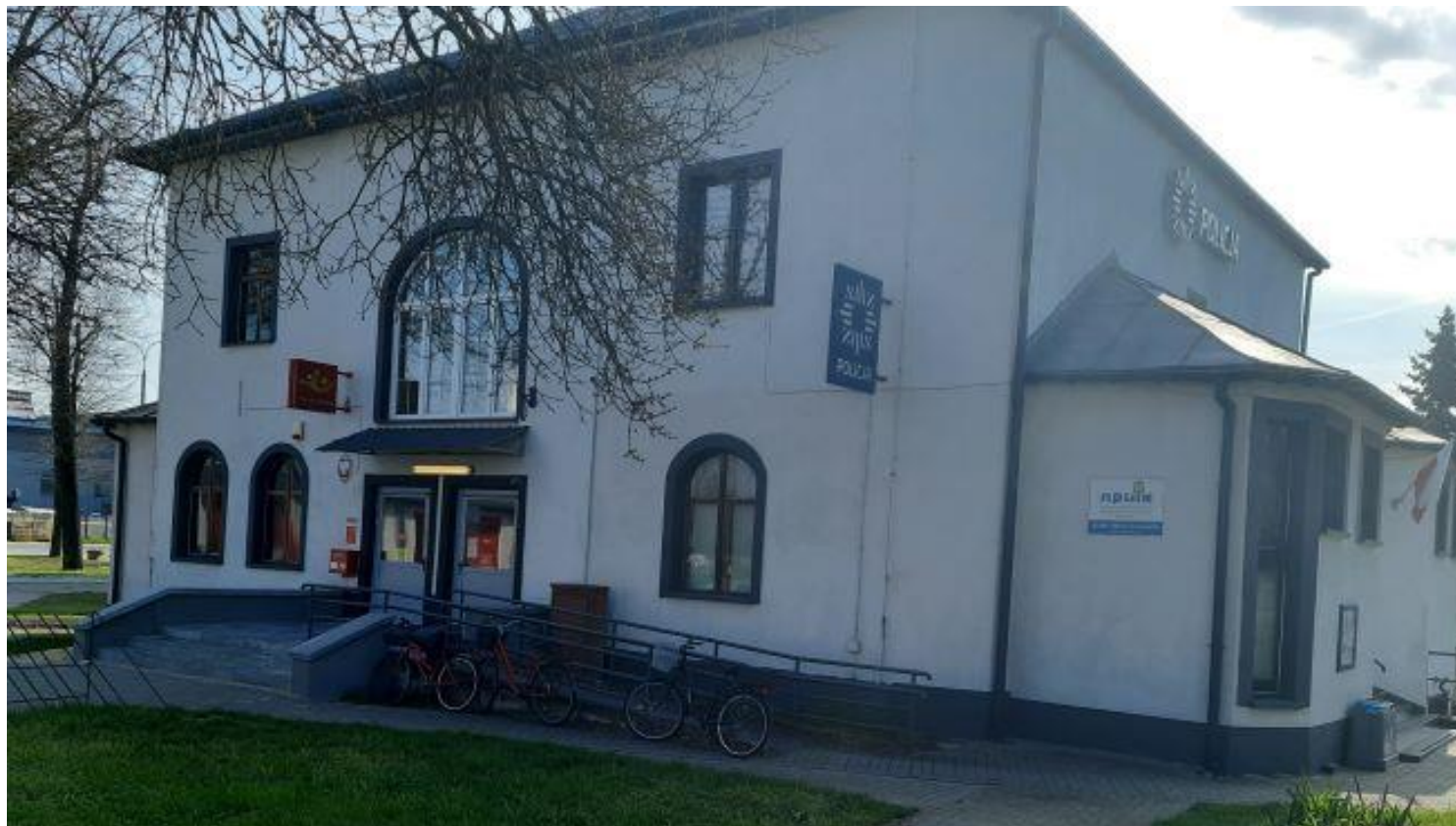
BUDYNEK POCZTY, UL. FRYDERYKA CHOPINA 1